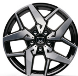
FELGA ALUMINIOWA 18" CR1811