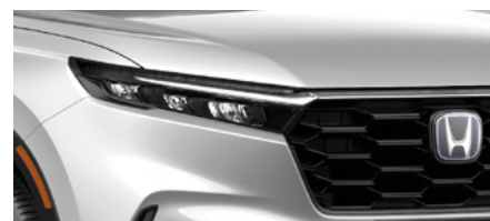
DIAMOND DUST PEARL