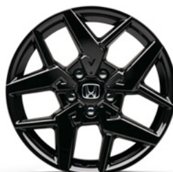
FELGA ALUMINIOWA 18" CR1812