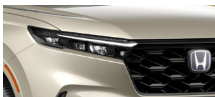
GOLD TITAN METALLIC