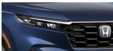
CANYON RIVER BLUE METALLIC