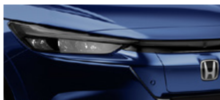
OBSIDIAN BLUE PEARL