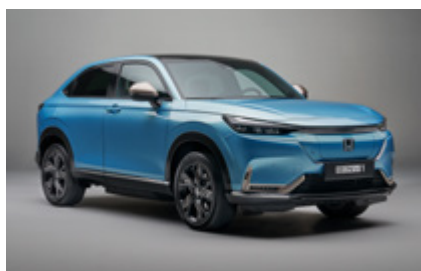
PAKIET ILMENITE TITANIUM