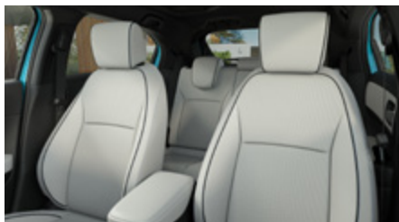
JASNOSZARA SKÓRZANA* (SYNTETYCZNA)