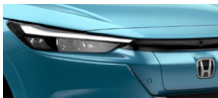
AQUA TOPAZ METALLIC