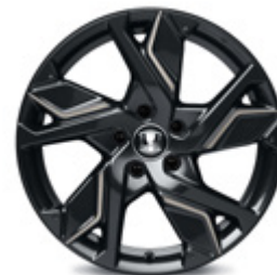
FELGA ALUMINIOWA 18" HR 1813