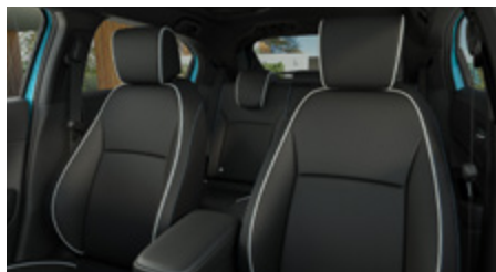
CZARNA SKÓRZANA* (SYNTETYCZNA)