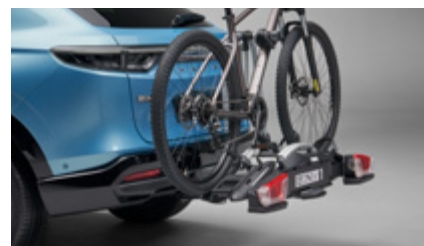
UCHWYT DO PLATFORMY ROWEROWEJ Z BAGAŻNIKIEM THULE