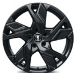
FELGA ALUMINIOWA 18" HR 1811