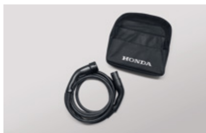
KABEL DO ŁADOWANIA GUN-TO-GUN