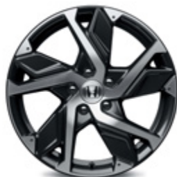
FELGA ALUMINIOWA 18" HR 1812