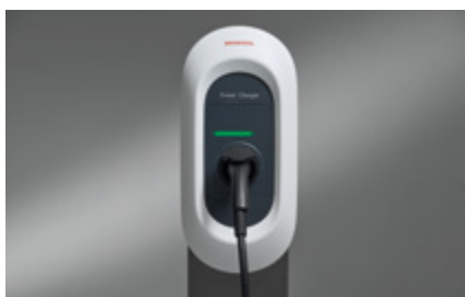
ŁADOWARKA HONDA POWER CHARGER