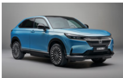
PAKIET OBSCURA BLACK