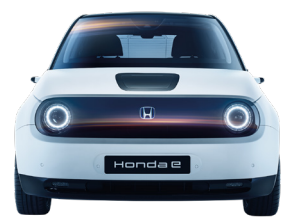
1 752 mm (szerokość z kamerami zamiast lusterek)