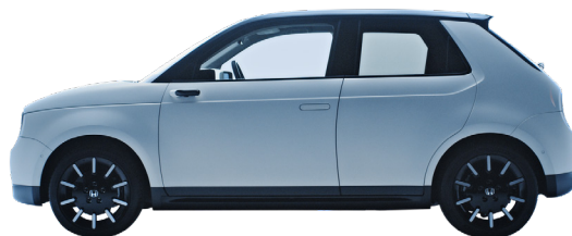
2 538 mm (rozstaw osi) 3 894 mm (długość)