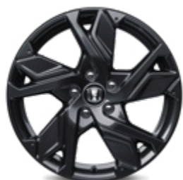
FELGA ALUMINIOWA 18" HR1811