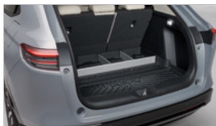
TACA BAGAŻNIKA Z PRZEGRÓDKAMI