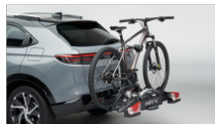
MOCOWANIE DO BAGAŻNIKA ROWEROWEGO