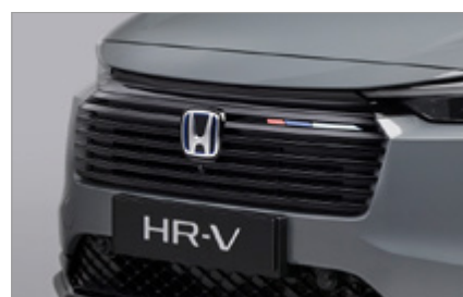
PRZEDNI GRILL W KOLORZE CZARNYM