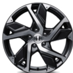
FELGA ALUMINIOWA 18" HR1812