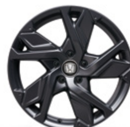
FELGA ALUMINIOWA 18" HR1814