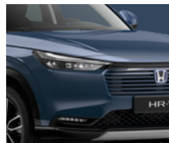
SEABED BLUE PEARL