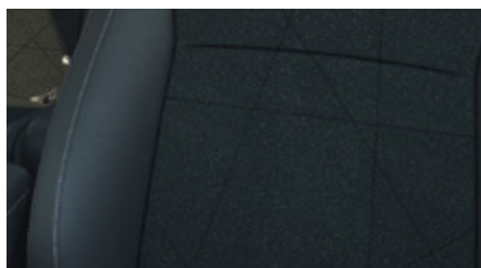
ŁĄCZONA MATERIAŁ (CZARNY) / SKÓRA SYNTETYCZNA (CZARNA)