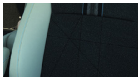
ŁĄCZONA MATERIAŁ (CZARNA) / SKÓRA SYNTETYCZNA (JASNOSZARA)