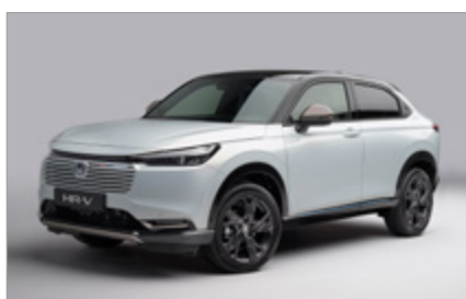
PAKIET PATINA BRONZE