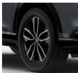
ELEGANCE / ADVANCE / ADVANCE STYLE / ADVANCE STYLE PLUS