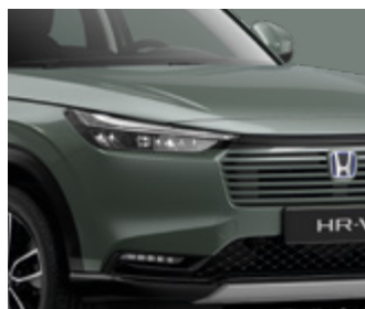
SAGE GREEN PEARL