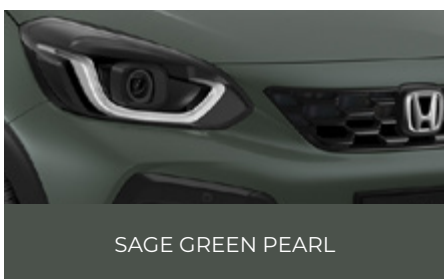
SAGE GREEN PEARL