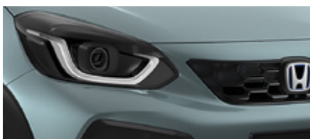
FJORD MIST PEARL