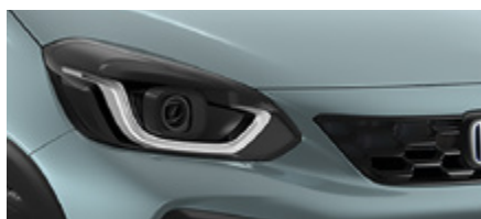
FJORD MIST PEARL