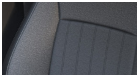
CZARNA ŁĄCZONA MATERIAŁ (HYDROFOBOWY) / SKÓRA (SYNTECYCZNA)*