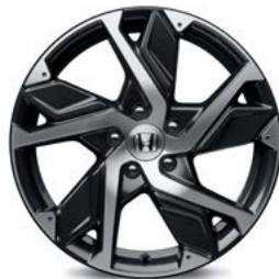
FELGA ALUMINIOWA 18" HR 1812