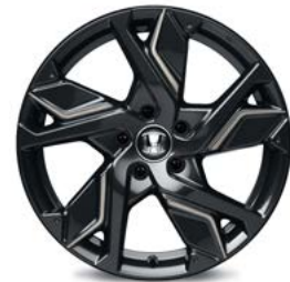
FELGA ALUMINIOWA 18" HR 1813