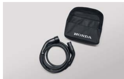
KABEL DO ŁADOWANIA GUN-TO-GUN