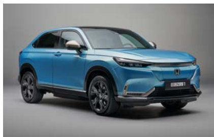
PAKIET ILMENITE TITANIUM