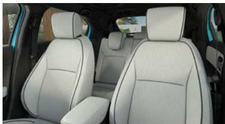
JASNOSZARA SKÓRZANA* (SYNTETYCZNA)