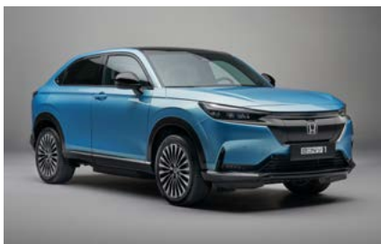
PAKIET OBSCURA BLACK