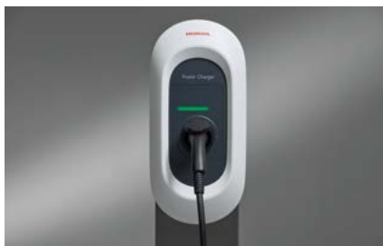
ŁADOWARKA HONDA POWER CHARGER