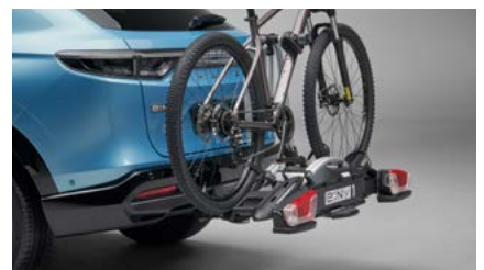
UCHWYT DO PLATFORMY ROWEROWEJ Z BAGAŻNIKIEM THULE