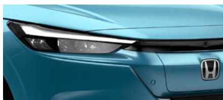
AQUA TOPAZ METALLIC