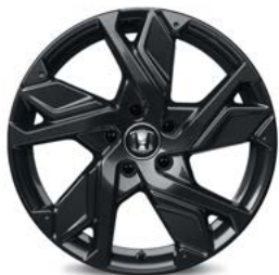
FELGA ALUMINIOWA 18" HR 1811