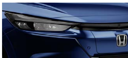
OBSIDIAN BLUE PEARL