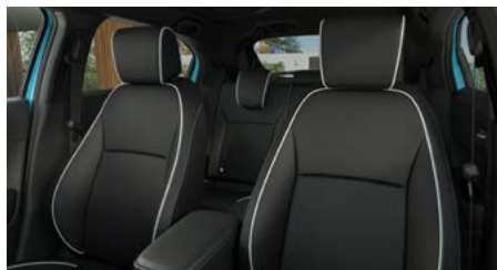
CZARNA SKÓRZANA* (SYNTETYCZNA)