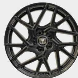
FELGA ALUMINIOWA 18" C11813