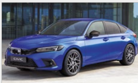
PAKIET CARBON (PEŁNY)