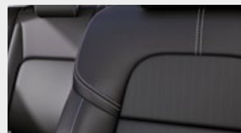
CZARNA SKÓRZANA (SKÓRA NATURALNA + SYNTETYCZNA)*