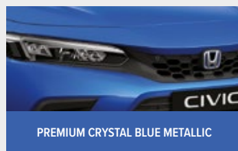
PREMIUM CRYSTAL BLUE METALLIC