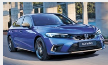
PAKIET ILMENITE TITANIUM