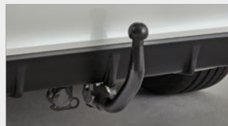
DEMONTOWALNY HAK HOŁOWNICZY