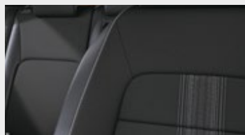
CZARNA ŁĄCZONA MATERIAŁ / SKÓRA SYNTETYCZNA