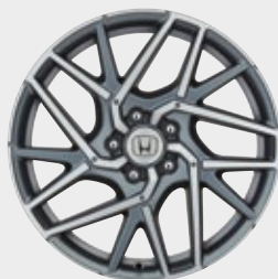
FELGA ALUMINIOWA 18" C11812