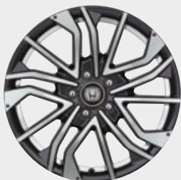
FELGA ALUMINIOWA 18" C11811