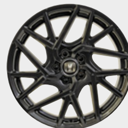
FELGA ALUMINIOWA 18" C11813