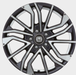
FELGA ALUMINIOWA 18" C11811