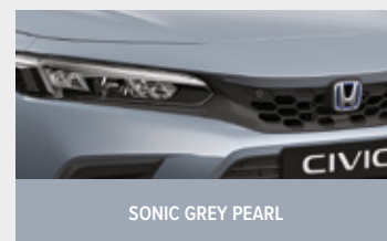
SONIC GREY PEARL