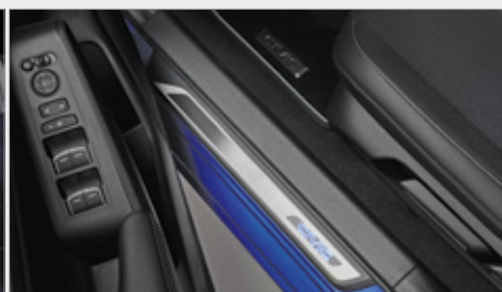
PAKIET ILUMINACYJNY PREMIUM - BIAŁY