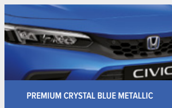
PREMIUM CRYSTAL BLUE METALLIC