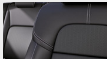
CZARNA SKÓRZANA (SKÓRA NATURALNA + SYNTETYCZNA)*