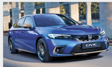
PAKIET ILMENITE TITANIUM