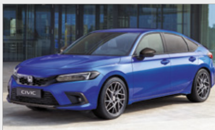
AKIET CARBON (PEŁNY)