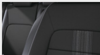
CZARNA ŁĄCZONA MATERIAŁ / SKÓRA SYNTETYCZNA