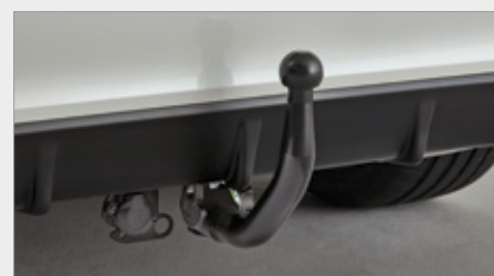
DEMONTOWALNY HAK HOŁOWNICZY

Elementy w pakiecie są również dostępne osobno. Felgi aluminiowe są opcjonalne, sprzedawane osobno. Producenci Akcesoriów zastrzegają sobie prawo do wprowadzania zmian w ich specyfikacji, kolorów i cen w wybranym przez siebie czasie z wcześniejszym powiadomieniem lub bez powiadomienia. Dotyczy to zarówno drobnych, jak i zasadniczych zmian. Niemniej jednak, staramy się, aby informacje zawarte na stronach niniejszego serwisu były zawsze jak najbardziej aktualne. Zalecamy naszym Klientom, aby zawsze konsultowali się w sprawie konkretnych danych o produktach z dealerami lub dystrybutorami, zwłaszcza, jeżeli wybór produktu uzależniony jest od reklamowanych cech i funkcji.