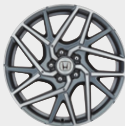
FELGA ALUMINIOWA 18" C11812