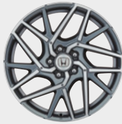
FELGA ALUMINIOWA 18" C11812