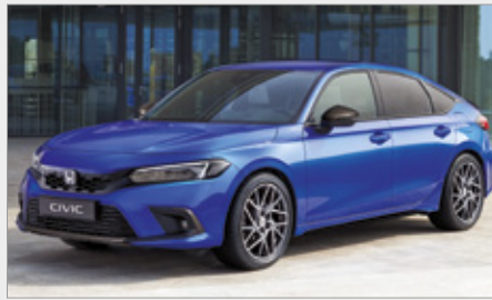
AKIET CARBON (PEŁNY)