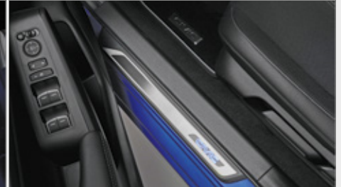
PAKIET ILUMINACYJNY PREMIUM - BIAŁY