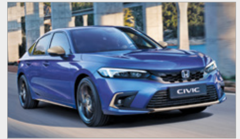
PAKIET ILMENITE TITANIUM