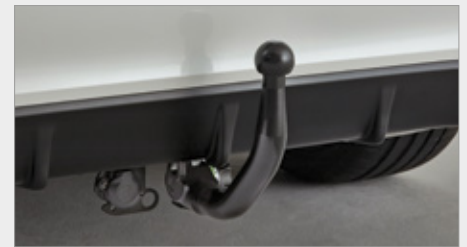
DEMONTOWALNY HAK HOLOWNICZY

Elementy w pakiecie są również dostępne osobno. Felgi aluminiowe są opcjonalne, sprzedawane osobno. Producenci Akcesoriów zastrzegają sobie prawo do wprowadzania zmian w ich specyfikacji, kolorów i cen w wybranym przez siebie czasie z wcześniejszym powiadomieniem lub powiadomienia. Dotyczy to zarówno drobnych, jak i zasadniczych zmian. Niemniej jednak, staramy się, aby informacje zawarte na stronach niniejszego serwisu były zawsze jak najbardziej aktualne. Zalecamy naszym Klientom, aby zawsze konsultowali się w sprawie konkretnych danych o produktach z dealerami lub dystrybutorami, zwłaszcza, jeżeli wybór produktu uzależniony jest od reklamowanych cech i funkcji.