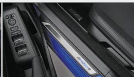
PAKIET ILUMINACYJNY PREMIUM - BIAŁY