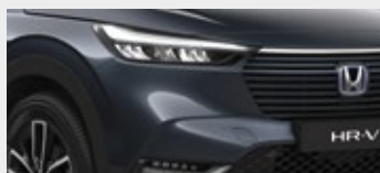
METEOROID GREY METALLIC