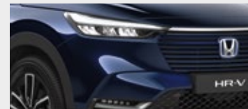
MIDNIGHT BLUE BEAM METALLIC