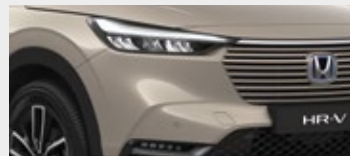
SAND KHAKI PEARL