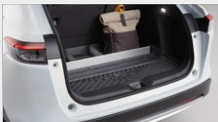
TACA BAGAŻNIKA Z PRZEGRÓDKAMI