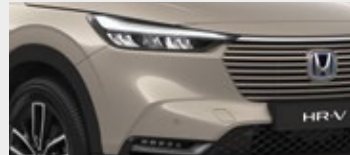
SAND KHAKI PEARL