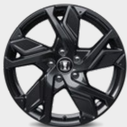
FELGA ALUMINIOWA 18" HR1811