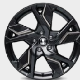
FELGA ALUMINIOWA 18" HR1813