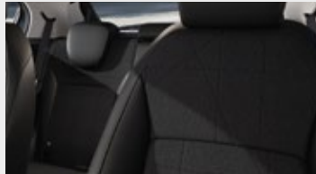
ŁĄCZONA MATERIAŁ (CZARNY) / SKÓRA SYNTETYCZNA (CZARNA)