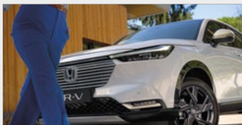
PAKIET ILMIENITE TITANIUM - ZEWNĘTRZNY I WEWNĘTRZNY