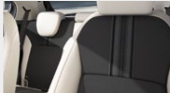
ŁĄCZONA MATERIAŁ (CZARNA) / SKÓRA SYNTETYCZNA (JASNOSZARA)