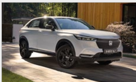
PAKIET OBSCURA BLACK