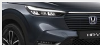
METEOROID GREY METALLIC