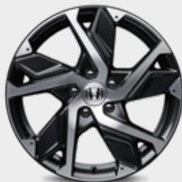
FELGA ALUMINIOWA 18" HR1812