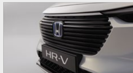
PRZEDNI GRILL W KOLORZE CZARNYM