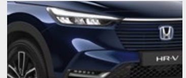
MIDNIGHT BLUE BEAM METALLIC