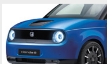
PREMIUM CRYSTAL BLUE METALLIC