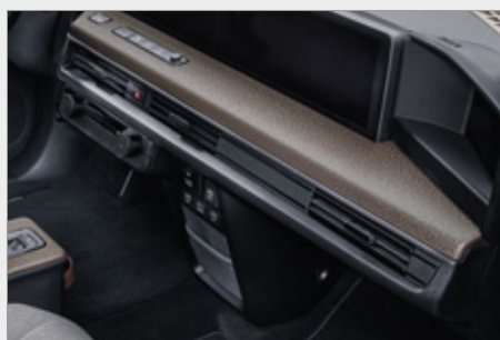
PANELE WNĘTRZA W KOLORZE MIEDZIANYM