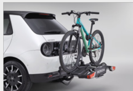
ZACZEP DO MONTAŻU BAGAŻNIKA ROWEROWEGO Z 13-STYK. WIĄZKĄ**