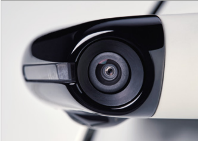
SYSTEM BOCZNYCH KAMER ZAMIAST LUSTEREK

Nowa Honda e to samochód zaprojektowany i ukształtowany przez miasto, dostosowany do nowoczesnego trybu życia. Samochód, który płynnie łączy wszystkie aspekty Twojego życia z nowoczesnymi, inteligentnymi technologiami łączności. Samochód, któremu nadaliśmy sportowy charakter, jednocześnie zapewniając zaskakująco wysoki poziom komfortu. I oczywiście samochód w pełni elektryczny i zeroemisyjny*. Witamy w świecie pojazdów nowej generacji!