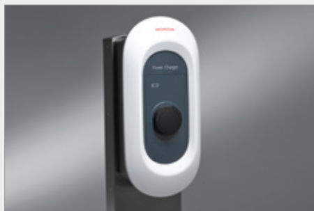
ŁADOWARKA HONDA POWER CHARGER