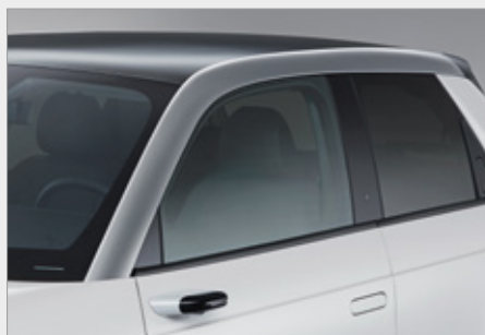
NAKŁADKA SŁUPKA A