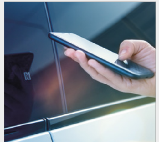
DOSTĘP DO USŁUG ŁĄCZNOŚCI PRZEZ APLIKACJĘ MY HONDA+