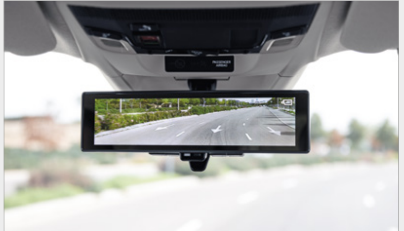
LUSTERKO WSTECZNE Z ZINTEGROWANYM WYŚWIETLACZEM