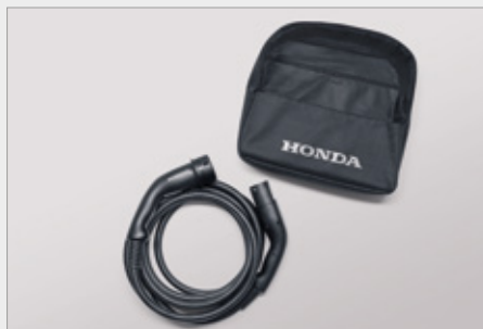
KABEL DO ŁADOWANIA MODE 3