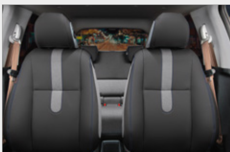
AKCESORYJNA TAPICERKA SKÓRZANA***