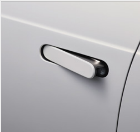
WYSUWANE KLAMKI DRZWI