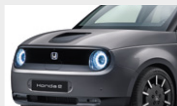
MODERN STEEL METALLIC