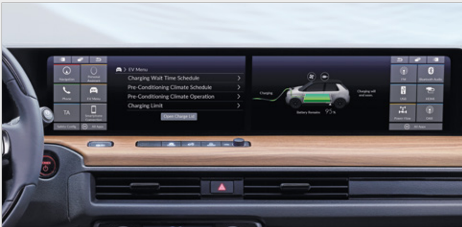
DWUEKRANOWY SYSTEM MULTIMEDIALNY HONDA CONNECT DUAL SCREEN