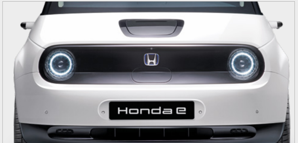
ZINTEGROWANE PRZEDNIE REFLEKTORY