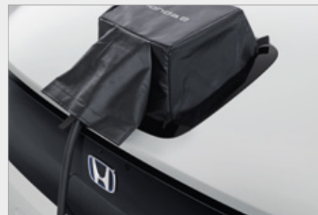
OSŁONA PORTU ŁADOWANIA