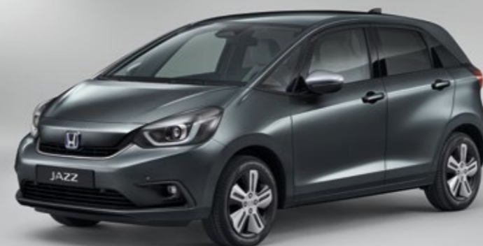
SHINING GRAY METALLIC