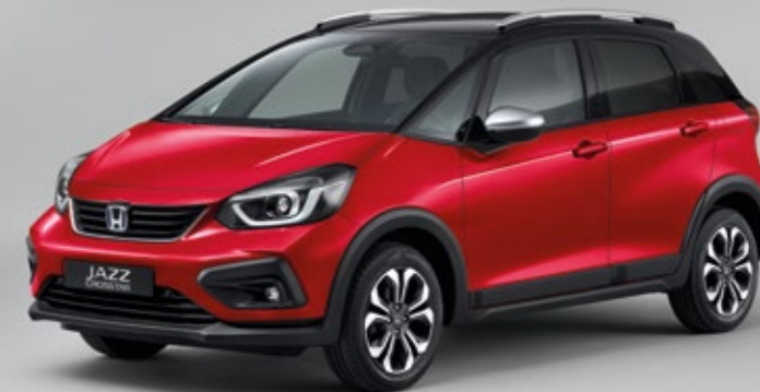
PREMIUM CRYSTAL RED METALLIC / CZARNY DACH

Na zdjęciu: Honda Jazz 1,5 i-MMD Crosstar Executive. Kolor Surf Blue i opcjonalny, czarny dach dostępne są tylko dla wersji Crosstar Executive.