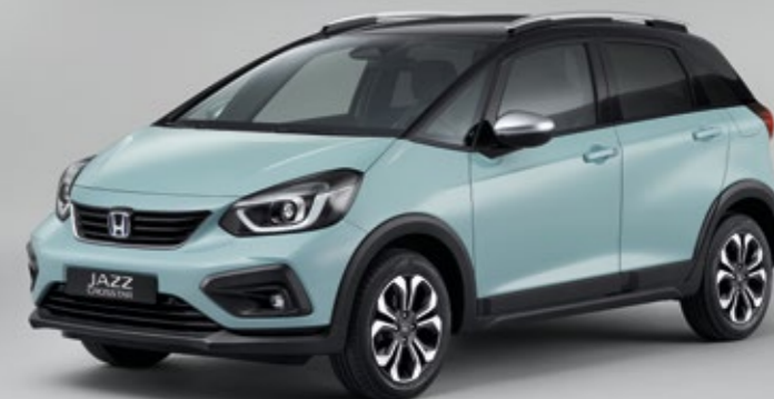
SURF BLUE / CZARNY DACH