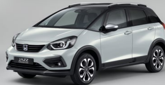
PREMIUM SUNLIGHT WHITE PEARL / CZARNY DACH