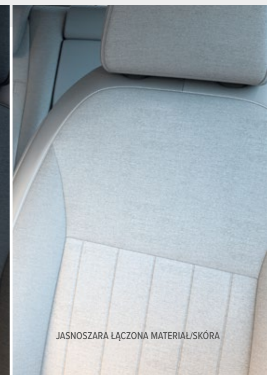
JASNOSZARA ŁĄCZONA MATERIAŁ/SKÓRA