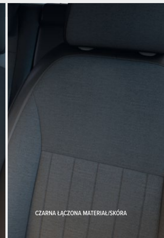
CZARNA ŁĄCZONA MATERIAŁ/SKÓRA