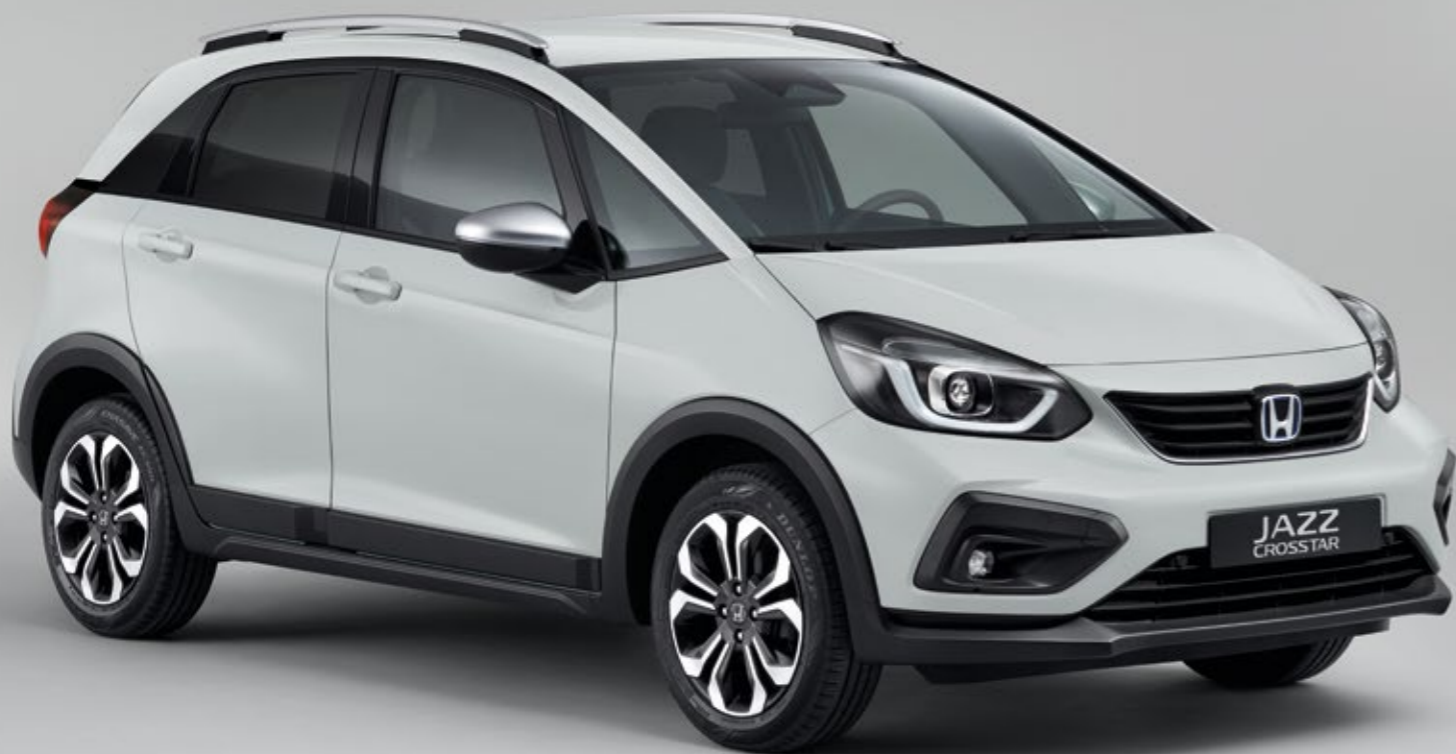
TAFFETA WHITE III

Nowy Jazz Crosstar dostępny jest w przyciągających wzrok kolorach, w tym w nowym kolorze Surf Blue i specjalnych kolorach Premium Sunlight White Pearl i Premium Crystal Red Metallic. Wersja Crosstar jest również oferowana z opcjonalnym, czarnym dachem (w kolorze Crystal Black). We wnętrzu znajdziemy tapicerkę wykonaną z hydrofobowej tkaniny, która ułatwia dbanie o czystość w środku samochodu.