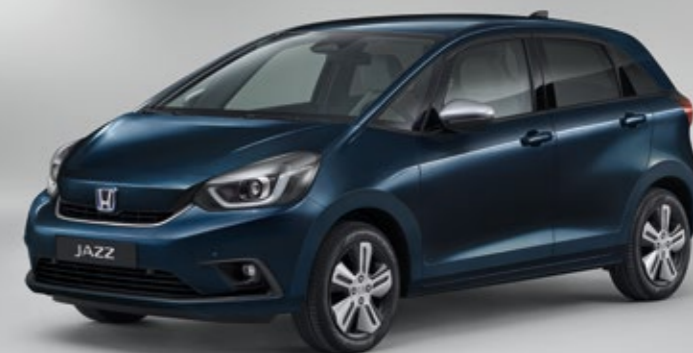
MIDNIGHT BLUE BEAM METALLIC