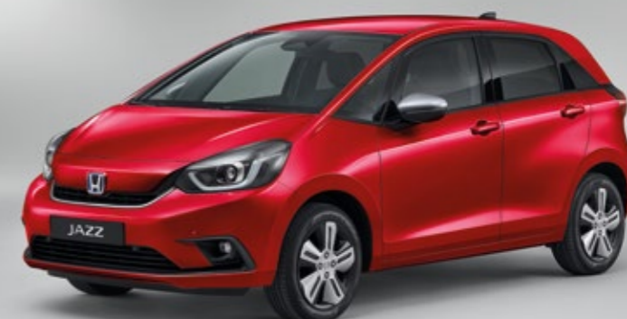
PREMIUM CRYSTAL RED METALLIC