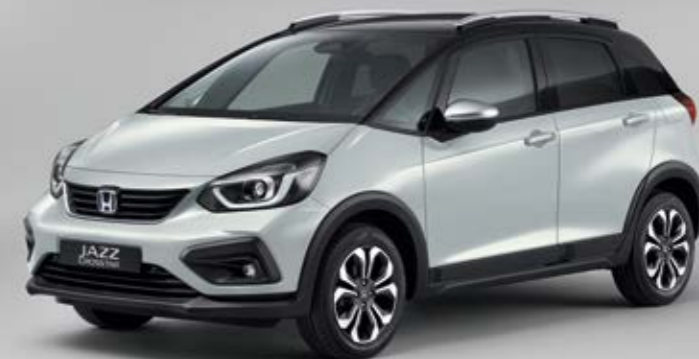
PREMIUM SUNLIGHT WHITE PEARL / CZARNY DACH