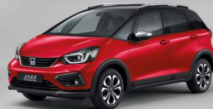
PREMIUM CRYSTAL RED METALLIC / CZARNY DACH

Na zdjęciu: Honda Jazz 1,5 i-MMD Crosstar Executive. Kolor Surf Blue i opcjonalny, czarny dach dostępne są tylko dla wersji Crosstar Executive.