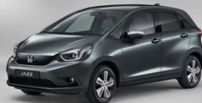
SHINING GRAY METALLIC