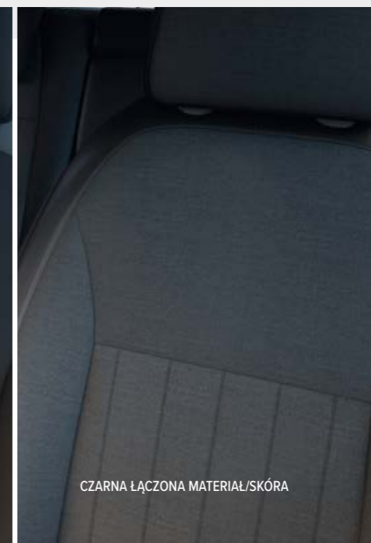
CZARNA ŁĄCZONA MATERIAŁ/SKÓRA