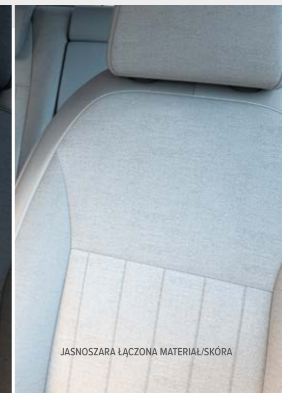
JASNOSZARA ŁĄCZONA MATERIAŁ/SKÓRA