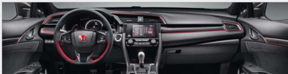
PAKIET KARBONOWY WEWNĘTRZNY