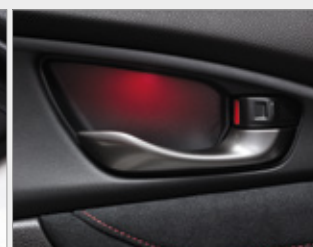
PAKIET ILUMINACYJNY CZERWONY