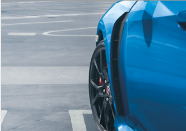
OTWORY CHŁODZĄCE OPTIMALIZUJĄCE PRZEPŁYW POWIETRZA

Poznaj najnowocześniejsze technologie i rozwiązania zaczerpnięte wprost z samochodów wyścigowych , które dostępne są w nowej Hondzie Civic Type R .