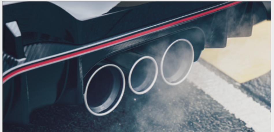
POTRÓJNY, CENTRALNIE UMIESZCZONY UKŁAD WYDECHOWY