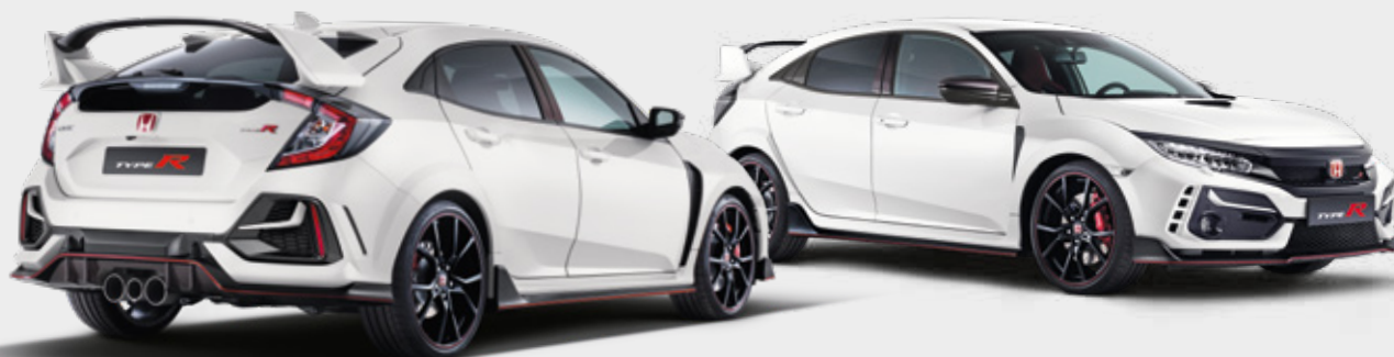
PAKIET KARBONOWY ZEWNĘTRZNY