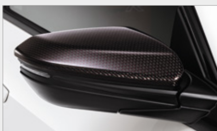
KARBONOWE OBUDOWY LUSTEREK