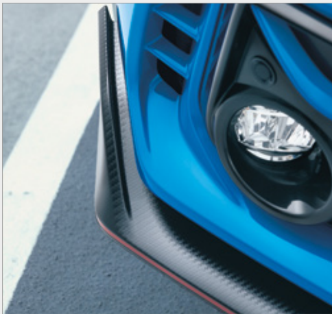
AERODYNAMICZNE KURTyny POWIETRZNE