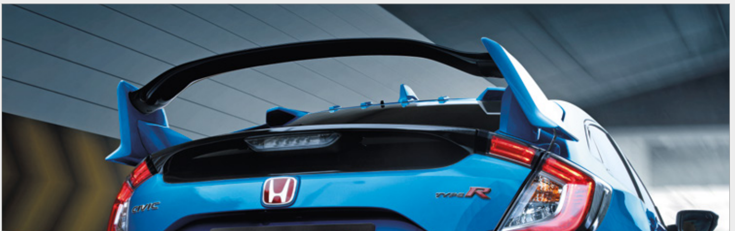
AERODYNAMICZNY TYLNY SPOJLER