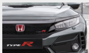
POLISHED METAL METALLIC