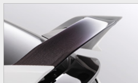
KARBONOWY SPOJLER TYLNY