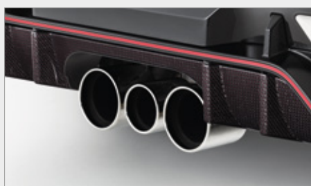
KARBONOWE ZDOBIENIE TYLNEGO DYFUZORA