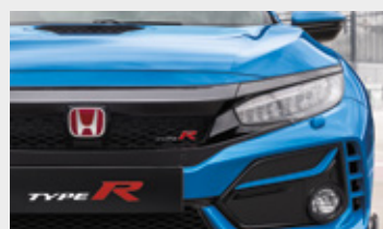
RACING BLUE PEARL

Honda Motor Europe Limited (Spółka z ograniczoną odpowiedzialnością) Oddział w Polsce zastrzega sobie prawo dokonywania w dowolnym czasie i bez uprzedzenia zmian parametrów technicznych, wyposażenia oraz specyfikacji pojazdów wyszczególnionych w tej ulotce. Ulotka oraz wszelkie zawarte w niej informacje nie stanowią oferty w rozumieniu prawa i są publikowane wyłącznie w celach informacyjnych. Indywidualne uzgodnienia dotyczące ceny, parametrów technicznych, wyposażenia oraz specyfikacji pojazdu następują w umowie jego sprzedaży. Gwarancja zostaje udzielona w momencie zakupu pojazdu a jej warunki zostają określone w odrębnym dokumencie gwarancyjnym. Wersja Base dostępna jest tylko w kolorze Rallye Red. Wersja Limited Edition dostępna jest tylko w dedykowanym kolorze Sunlight Yellow.