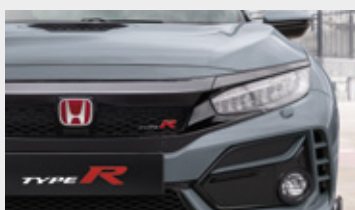
SONIC GREY PEARL