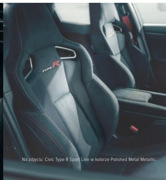
Na zdjęciu: Civic Type R Sport Line w kolorze Polished Metal Metallic.