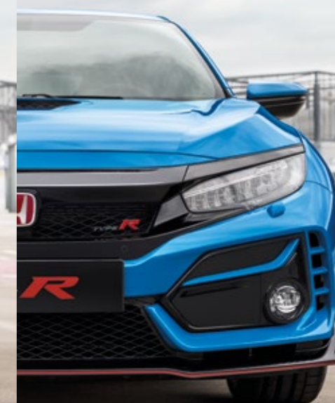
RACING BLUE PEARL