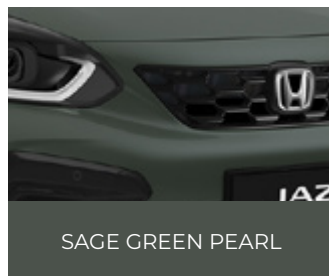
SAGE GREEN PEARL