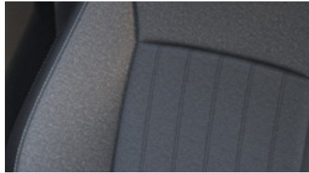
CZARNA ŁĄCZONA - MATERIAŁ (HYDROFOBOWY) / SKÓRA (SYNTECYCZNA)*