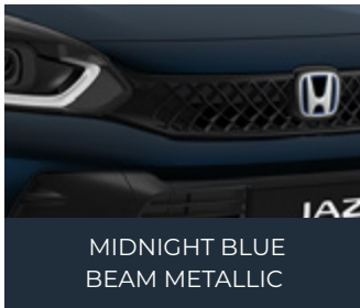
MIDNIGHT BLUE BEAM METALLIC