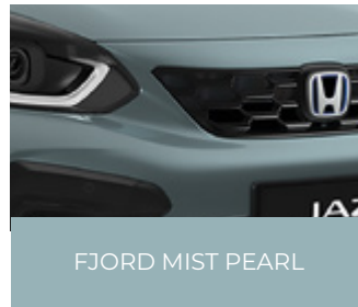
FJORD MIST PEARL