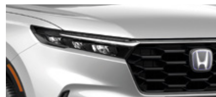
DIAMOND DUST PEARL