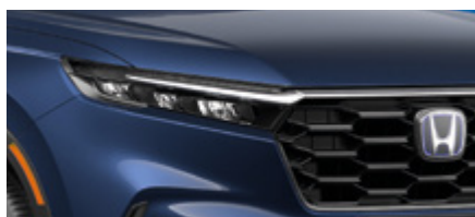
CANYON RIVER BLUE METALLIC