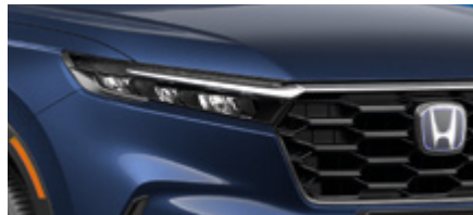
CANYON RIVER BLUE METALLIC