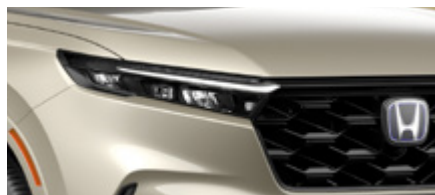
GOLD TITAN METALLIC