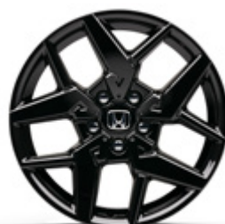
FELGA ALUMINIOWA 18" CR1812