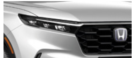
DIAMOND DUST PEARL