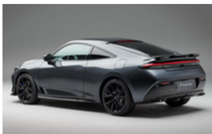
PAKIET BERLINA BLACK