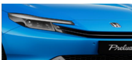
RACING BLUE PEARL