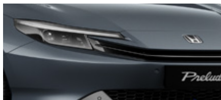
METEOROID GREY METALLIC