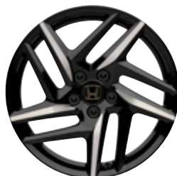
FELGA ALUMINIOWA 19" PR1901