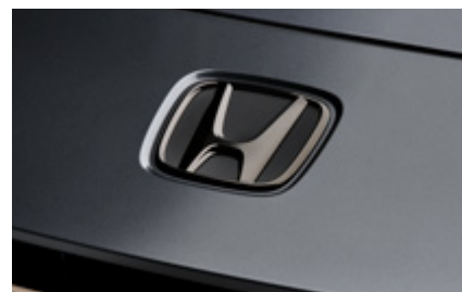
PAKIET CZARNYCH EMBLEMATÓW