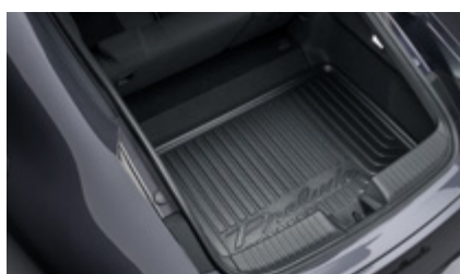
MATA OCHRONNA BAGAŻNIKA