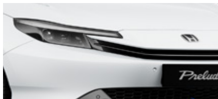
MOONLIT WHITE PEARL