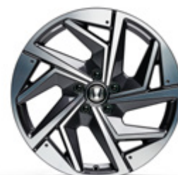
FELGA ALUMINIOWA 19" ZR1901