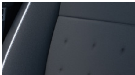
CZARNA ŁĄCZONA MATERIAŁ / SKÓRA SYNTETYCZNA