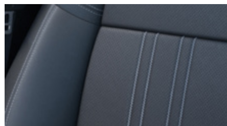
CZARNA SKÓRZANA* (SKÓRA NATURALNA + SYNTETYCZNA)