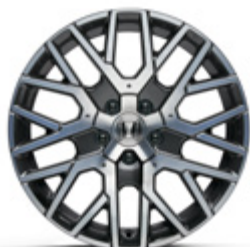
FELGA ALUMINIOWA 18" ZR1801