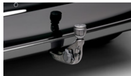
HAK HOLOWNICZY (STAŁY LUB SKŁADANY)