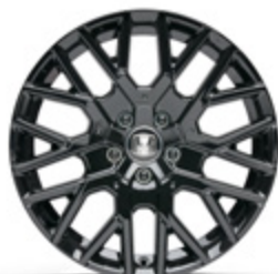
FELGA ALUMINIOWA 18" ZR1802