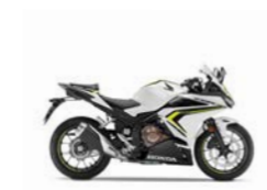
Pearl Metalloid White