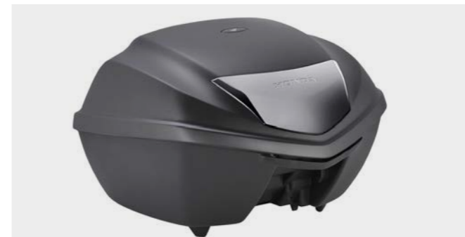
Zestaw kufera górnego 35L 08ESY-MKP-TB19

Zestaw obejmuje kufer górny 35 litrów i wszystkie elementy niezbędne do zamontowania (stelaż kufera i podstawa). System obsługi jednym kluczykiem. Torba wewnętrzna w zestawie (08L09-MGS-D30).