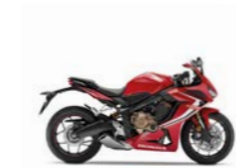
Grand Prix Red