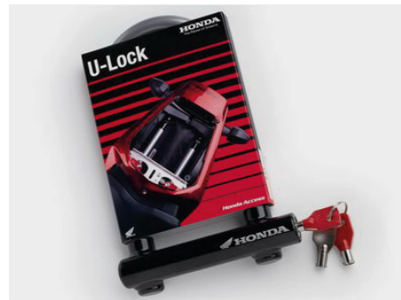
Blokada U-Lock 08M53-MFL-800

Rurowy, stalowy stojak ułatwiający czyszczenie i konserwację tylnego koła. Umożliwia podnoszenie motocykla za tylny wahacz.