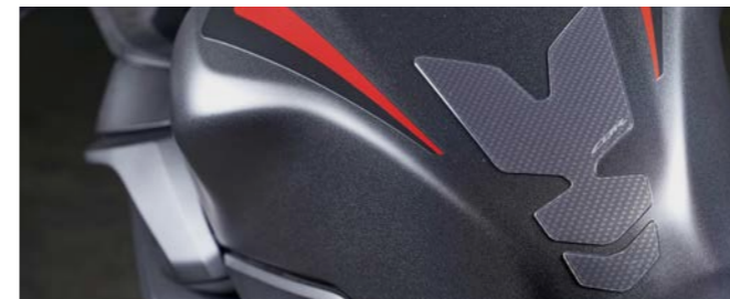
Tankpad (logo CBR) 08P71-MKF-DK0

Nowa stylistyka! Tankpad w kolorze szarym w kształcie strzały z logo CBR. Chroni zbiornik przed zarysowaniami.