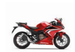
Grand Prix Red