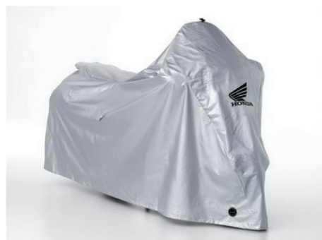
Pokrowiec stosowany na zewnątrz 08P34-BC2-801

Wodoodporny, oddychający materiał, który umożliwia wyschnięcie pod przykryciem. Zabezpiecza lakier przed promieniami UV. Regulowana linka zabezpieczająca i dwa otwory z przodu do montażu blokady U-lock.