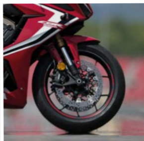
Zestaw ozdobnych naklejek koła – czerwone 08F84-MFJ-820A

Wysokiej jakości aluminiowe panele poprawiające wygląd CBR650R. - Wstawka nakładki tylnego siedzenia (08F76) - Panele przedniego błotnika (08F73) - Panele osłon bocznych (08F75)