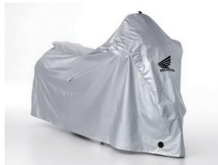
Pokrowiec stosowany na zewnątrz 08P34-BC2-801

Wodoodporny, oddychający materiał, który umożliwi wyschnięcie pod przykryciem. Zabezpiecza lakier przed promieniami UV. Regulowana linka zabezpieczająca i dwa otwory z przodu do montażu blokady U-lock.