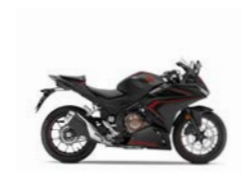
Mat Axis Gray Metallic