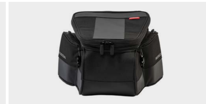
Torba na tylne siedzenie 08ESY-MKJ-STB18

Praktyczna torba o pojemności 3 litrów dopasowana do zbiornika paliwa. Stabilny uchwyt montażowy nie ogranicza ruchów kierowcy. Przezroczysta kieszeń na górnej klapie umożliwi łatwe przewożenie smartfona. Mocowanie i pokrowiec przeciwdeszczowy w zestawie. Wymiary w mm (sz. x dł. x wys.): 178 x 285 x 130