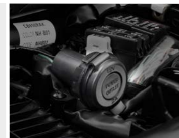
Gniazdo akcesoriów 12 V 08U70-MKN-D50

Wysoka szyba zapewni lepszą ochronę przed wiatrem nie ograniczając widoczności. Dostępne dwie wersje: - Przezroczysta (08R70) - Przyciemniona (08R71)