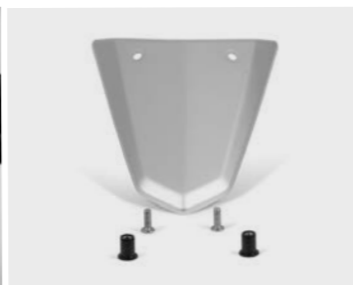
Panele aluminiowe 08F73-MKN-D50 | 08F75-MKN-D50 | 08F76-MKN-D50

Podkreśli sportowy wygląd CBR650R montując nakładkę tylnego siedzenia z wygodnym oparciem. Aby jeszcze mocniej podkreślić charakter motocykla można zamontować aluminiowe panele (08F76-MKN-D50 / sprzedawana osobno). Dostępne w dwóch kolorach: - Grand Prix Red "R-380" (D50ZA) - Mat Gunpowder Black Metallic "NH-436M" (D50ZB)