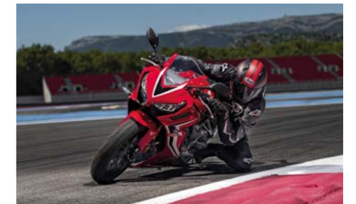
CBR650R w akcji.

Od wprowadzenia modelu ST1100 znanego jako „Pan European” Honda wyposaża coraz więcej motocykli w układ kontroli momentu obrotowego (HSTC). System ten stale monitoruje prędkości kół przednich i tylnych za pomocą czujników prędkości wbudowanych w układ ABS. Gdy tylne koło zaczyna obracać się znacznie szybciej niż przednie, układ zmniejsza dopływ paliwa do silnika i ogranicza poślizg tylnego koła. W 2019 roku prezentując nowy model CBR650R Honda po raz pierwszy zastosowała tę technologię w motocyklu SuperSport o średniej pojemności. Kierowca ma możliwość wyłączenia układu.