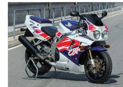
CBR900RR Fireblade – od niego wszystko się zaczęło.

Chcąc stworzyć wyczynowy motocykl, który pokona RVF750 w wyścigach drogowych Endurance, Honda zrealizowała projekt badawczo-konstrukcyjny, którego rezultatem był zaprezentowany w 1992 roku model CBR900RR. Dysponował on mocą 128 KM, co nie było rekordową wartością w tamtych czasach. Jednak dzięki masie własnej 185 kg, podczas gdy wszyscy rywale przekraczali 200 kg, pierwszy Fireblade, nazywany przez fanów „Blade”, był tak łatwy w prowadzeniu, jakby czytał w myślach kierowcy. Ponad 25 lat później najmocniejsze i najwinniejsze motocykle Honda mają w sobie geny Blade'a.