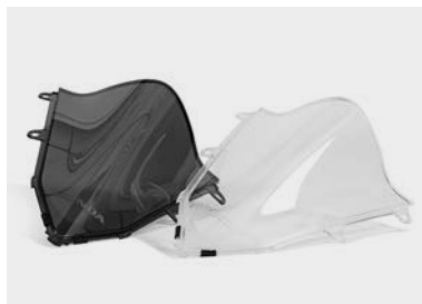
Wysoka szyba 08R70-MKN-D10 | 08R71-MKN-D10

Wysoka szyba zapewni lepszą ochronę przed wiatrem nie ograniczając widoczności. Dostępne dwie wersje: - Przezroczysta (08R70) - Przyciemniona (08R71)