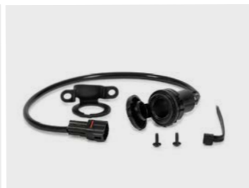
Gniazdo 12 V 08U70-MJW-J00

Ultracienkie podgrzewane manetki (360°) z trzema poziomami grzania. Zabezpieczają miejsca rąk najbardziej narażone na wyziębienie. Zintegrowany przełącznik sterujący daje maksymalny poziom komfortu. Zintegrowany obwód zabezpieczający akumulator przed rozładowaniem. Zestaw montażowy w komplecie (08E00-MJW-J00). Dostępny oryginalny, odporny na ciepło klej do montażu manetek Honda (sprzedawany oddzielnie)