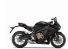
Mat Gunpowder Black Metallic