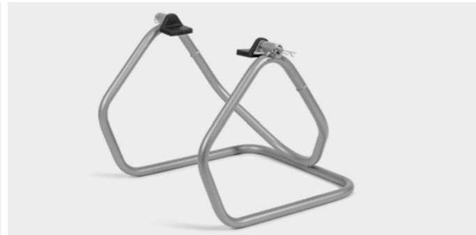
Stojak warsztatowy 08M50-MWO-801

Dostosowana do wszystkich typów akumulatorów kwasowo-olowiowych 12 V o pojemności od 3 do 50 Ah. Skuteczna w przypadku silnie rozładowanych akumulatorów (nawet 2 V). Nie stwarza ryzyka przegrzania. W pełni bezpieczna dla elektroniki pojazdu.