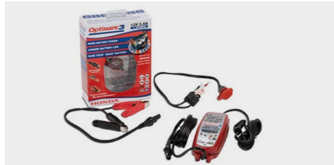
Ładowarka Honda Optimate 3 08M51-601E

Dostosowana do wszystkich typów akumulatorów kwasowo-olowiowych 12 V o pojemności od 3 do 50 Ah. Skuteczna w przypadku silnie rozładowanych akumulatorów (nawet 2 V). Nie stwarza ryzyka przegrzania. W pełni bezpieczna dla elektroniki pojazdu.