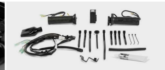
Podgrzewane manetki 08ESY-MKN-HG19B

Montowane pod siedzeniem gniazdo 12 V do zasilania urządzeń elektrycznych.