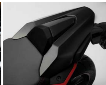
Nakładka tylnego siedzenia 08F72-MKN-D50ZA lub B

Zestaw Quick Shifter pozwala na zmianę biegów bez włączania sprzęgła i zamykania przepustnicy. System umożliwi zmianę biegów do góry, zapewniając maksymalną przyjemność z jazdy.