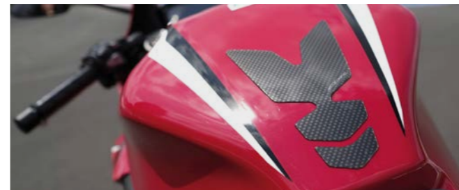
Tankpad (logo CBR) 08P71-MKF-DK0

Nowa stylistyka! Tankpad w kolorze szarym w kształcie strzały z logo CBR. Chroni zbiornik przed zarysowaniami.