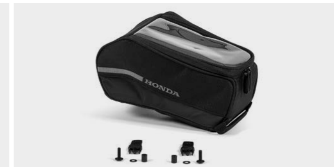
Torba na bak 08ESY-MKP-TKB19

Zestaw obejmuje kufer górny 35 litrów i wszystkie elementy niezbędne do zamontowania (stelaż kufera i podstawa). System obsługi jednym kluczykiem. Torba wewnętrzna w zestawie (08L09-MGS-D30).