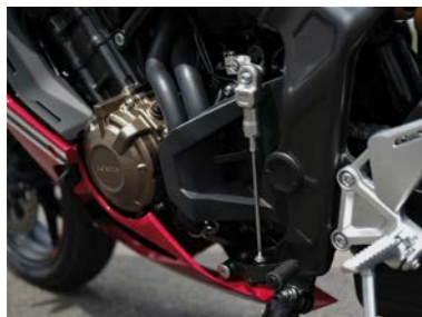
Zestaw Quick Shifter 08U72-MKN-D50

Zestaw Quick Shifter pozwala na zmianę biegów bez włączania sprzęgła i zamykania przepustnicy. System umożliwi zmianę biegów do góry, zapewniając maksymalną przyjemność z jazdy.