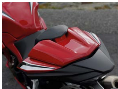
Nakładka tylnego siedzenia 08F72-MKP-J00ZA, L lub R

Zamontowana zamiast tylnego siedzenia podkreśla agresywny wygląd. Dostępna w trzech kolorach dopasowanych do lakieru CBR500R.