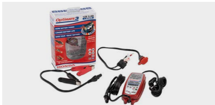
Ładowarka Honda Optimate 3 08M51-601E

Dostosowana do wszystkich typów akumulatorów kwasowo-olowiowych 12 V o pojemności od 3 do 50 Ah. Skuteczna w przypadku silnie rozładowanych akumulatorów (nawet 2 V). Nie stwarza ryzyka przegrzania. w pełni bezpieczna dla elektroniki pojazdu.