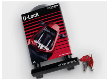
Blokada U-Lock 08M53-MFL-800

Dostosowana do wszystkich typów akumulatorów kwasowo-olowiowych 12 V o pojemności od 3 do 50 Ah. Skuteczna w przypadku silnie rozładowanych akumulatorów (nawet 2 V). Nie stwarza ryzyka przegrzania. w pełni bezpieczna dla elektroniki pojazdu.