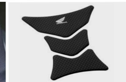
Tank pad Honda Wing 08P61-KAZ-800A

Nowa stylistyka! Tankpad w kolorze szarym w kształcie strzały z logo CBR. Chroni zbiornik przed zarysowaniami.