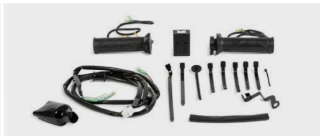
Podgrzewane manetki kierownicy 08ESY-MJR-HG17

Przeciwniona szyba wyższa od standardowej zapewni lepszą ochronę przed wiatrem.