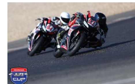
Zawody CBR500R Cup.

Nie jeden egzemplarz CB500 bezawaryjnie pokonał 300 000 km. Ale często wybierany przez kurierów i szkoły nauki jazdy model jest czymś o wiele więcej niż pojazdem roboczym. Rozegrane po raz pierwszy w 1996 roku we Francji zawody CB500 Cup szybko zyskały popularność w Europie. Od 2014 roku młodzi, utalentowani zawodnicy ścigają się na CBR500R, zdobywając uznanie bez olbrzymich nakładów finansowych. Należą do nich między innymi Sebastien Charpentier i James Toseland.