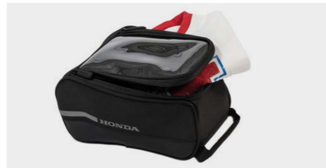
Torba na bak 08ESY-MKJ-TKB18

Praktyczna torba o pojemności 3 litrów dopasowana do zbiornika paliwa. Stabilny uchwyt montażowy nie ogranicza ruchów kierowcy. Przezroczysta kieszeń na górnej klapie umożliwi łatwe przewożenie smartfona. Mocowanie i pokrowiec przeciwdeszczowy w zestawie. Wymiary w mm (sz. x dł. x wys.): 178 x 285 x 130