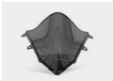
Wysoka przednia szyba (przeciwniona) 08R70-MKP-D00ZA

Przeciwniona szyba wyższa od standardowej zapewni lepszą ochronę przed wiatrem.